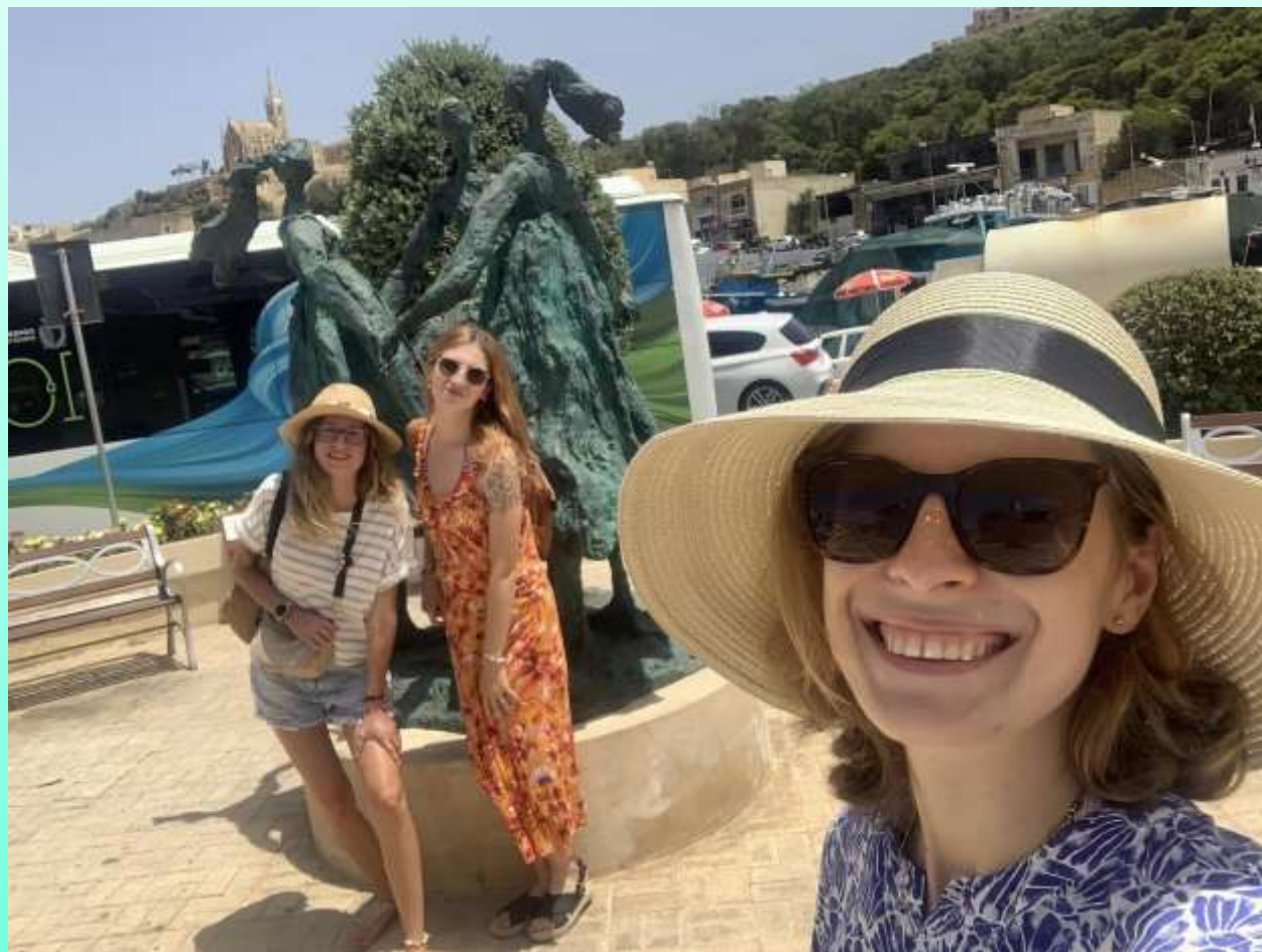
Trio Przedszkola Marco Polo na Malcie (Valletta)